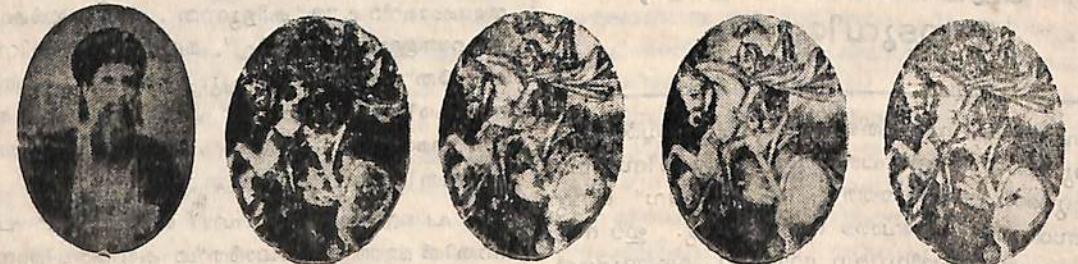
ഏബ്രഹാം തോമസ്, ബഥേൽ ഭവൻ.